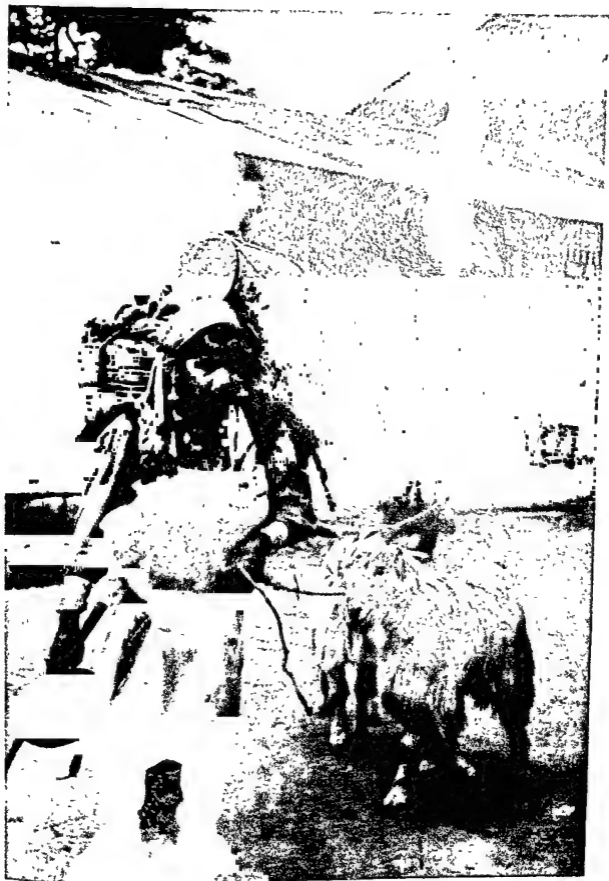
कुल्लू भीर बांगड़ा के यायावर